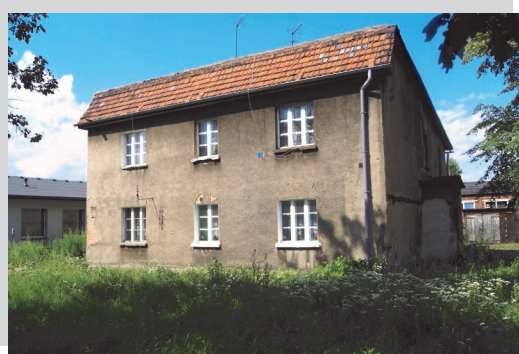
Dom robotniczy zbudowany dla pracowników stalowni. Stan obecny.