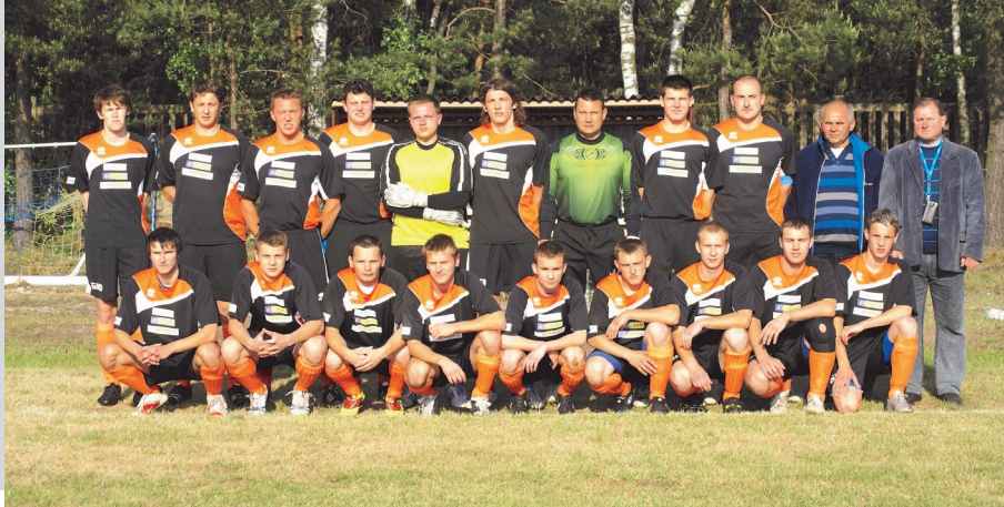
Kadra KS Unia Kalety.

P rzygotowująca się do rozgrywek w sezonie 2012/2013 kaletańska Unia zakończyła okres przygotowawczy ostatnimi sparingami z Sokółem Orzech i Uranią Ruda Śląska.