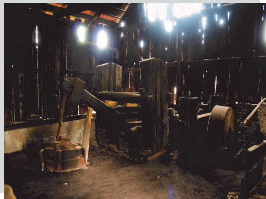
Wnętrze kuźnicy z początku XIX w. Na pierwszym planie młot znany nam z kaletańskiego i katowickiego herbu.