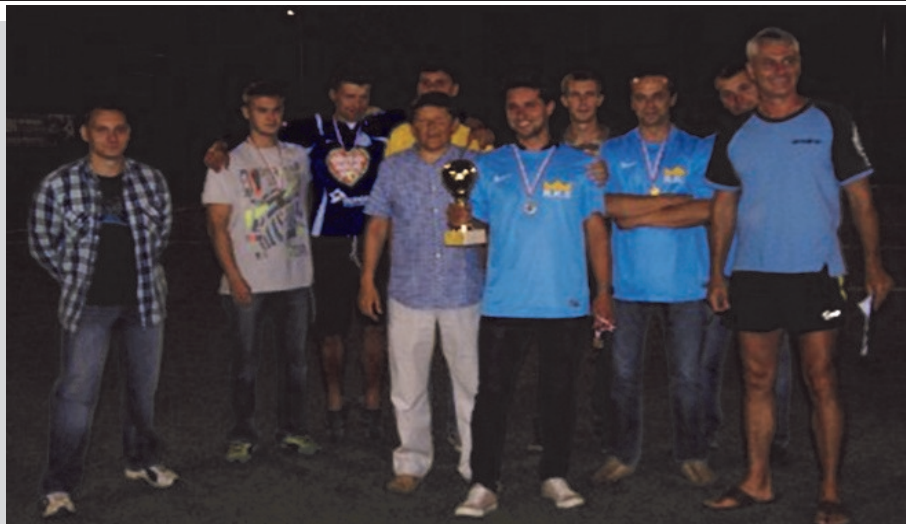
Zwycięska drużyna RKS